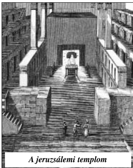
A jeruzsálemi templom

Később a jeruzsálemi templomban is volt egy külön udvar a pogányok számára. Oda ugyan bemehettek, de áldozatokat nem mutathattak be. Ennél beljebb viszont nem juthattak. Sőt, az egyik falon latinul és görögül is egy felírat volt olvasható, amely halálbüntetés kilátásba helyezése mellett tiltotta a templom belsőbb részei felé való továbbhaladást. 2