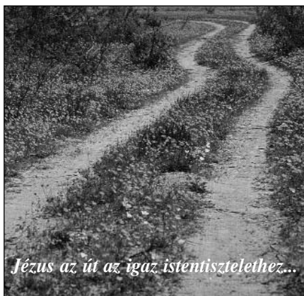
Jézus az út az igaz istentisztelethez...