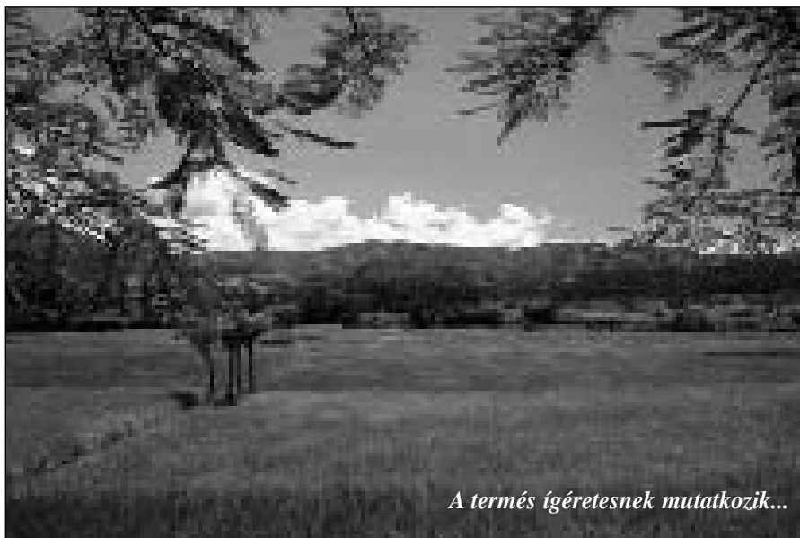
A termés ígéretesnek mutatkozik...

ember, lefejezi inkább az igét, minthogy bűneit ölné meg. Egy darabig talán még lehet ilyen megosztott szívvel élni, de egyszer kibújik a szög a zsákból, azaz mindig kibújik, amikor az emberi érdekek és az Isten szava keresztüztébe kerül. Ilyenkor, szinte gondolkodás nélkül az Istent tagadja meg, de nem önmagát. Ezeket az embereket nevezhetjük képmutatóknak, akik még templomba is járnak, s annyira becsapják magukat, hogy a keresztyének táborába sorolják meghasonlott életüket. Ó, milyen szomorú ezeknek az állapota, s ha nem tévedek, az ilyenből van a legtöbb.