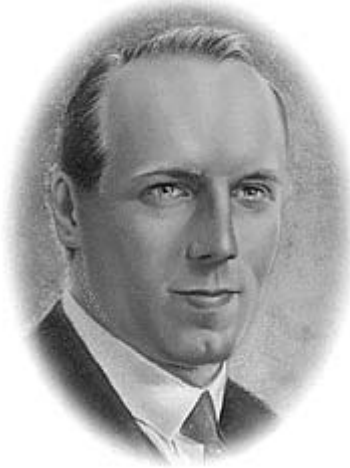
Eric Henry Liddell

Hetvenkilenc évvel ezelőtt zajlottak a párizsi olimpiai játékok. Az összes résztvevő versenyző közül, senkinek a neve nem maradt meg annyira az emberek emlékezetében, mint azé a skót fiatalemberé, aki megnyerte a 400 m-es síkfutást. Ő volt Eric Henry Liddell.