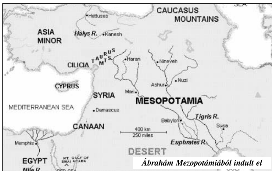
Ábrahám Mezopotámiából indult el