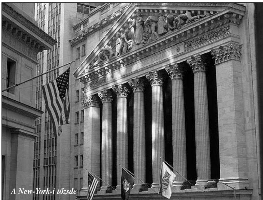
A New-York-i tőzsde