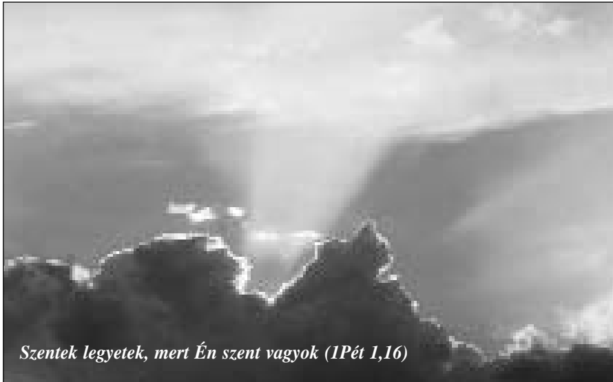
Szentek legyetek, mert Én szent vagyok (IPét 1,16)

gunkat arra, hogy Isten szentsége elválaszt minket Tőle, ugyanakkor meg is mutatja az Ő szentségét.