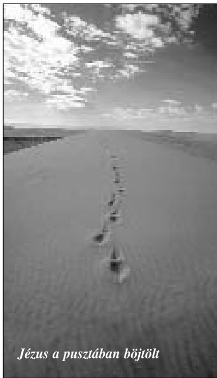
Jézus a pusztában böjtölt

A hívő emberrel is előfordulhat az, hogy nem tudja mit is cselekedjen életének bizonyos szakaszaiban. Ilyenkor akár böjtöléssel is keresheti Isten vezetését. A Bírák 20-ban arról olvasunk, hogy Izrael fiai harcra gyűltek össze Benjámintörzse ellen, mert azok vétkeztek Isten ellen. Habár Izrael többi törzse 15-szörös túlerőben voltak, mégis Istenhez fordultak. Ennek ellenére csatát vesztek másnap, sőt az azt követő napon is. Ekkor a zsidók könnyek