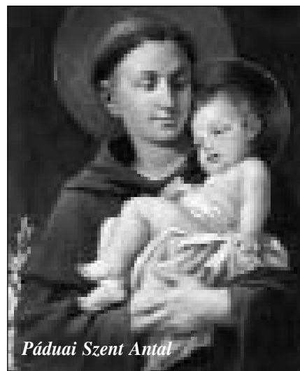
Páduai Szent Antal

2003. április 13-án az Úr kegyelméből a gyülekezet tagja lettem, és ezért nagyon hálás vagyok. Kérem a mi kegyelmes Urunkat, hogy ne engedjen leterülni a keskeny útról. Kérem Őt, hogy erősítsen hitben, szeretetben és mindennap juttassa eszembe az Ő nagy munkáját, amit véghezvitt életemben.