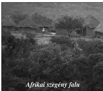
Afrikai szegény falu

Elfelejtjük, hogy az emberi nemzetség része vagyunk, azé a nemzetségé, amely fellázadt Isten ellen és most elszakadt Tőle. Az első szörnyű engedetlenség óta mindenkinek – férfiaknak és nőknek egyaránt –, segítség nélkül kell küzdeniük abban a világban, mely az Ő haragja alatt áll.