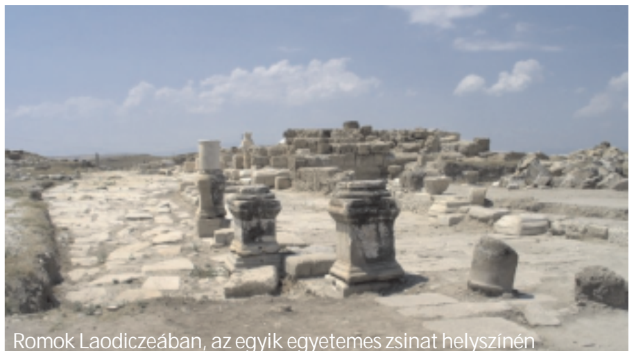
Romok Laodiczeában, az egyik egyetemes zsinat helyszínén