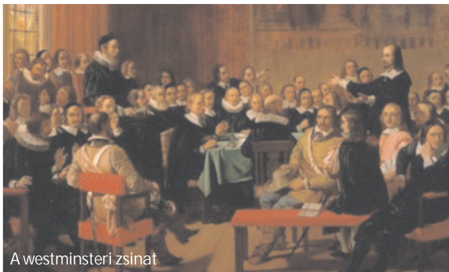
A westminsteri zsinat

De ahol fel is állítottak valamiféle „presbitériumot”, továbbra is a