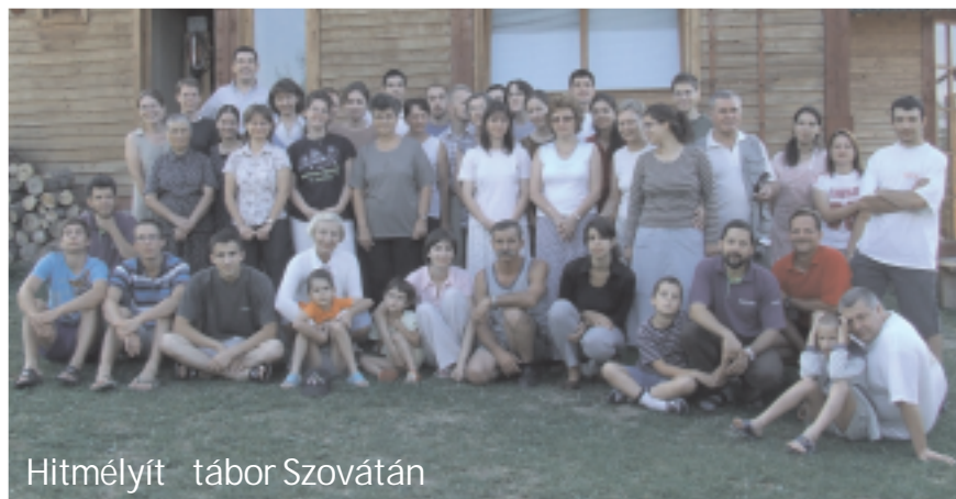
Hitmélyít tábor Szovátán