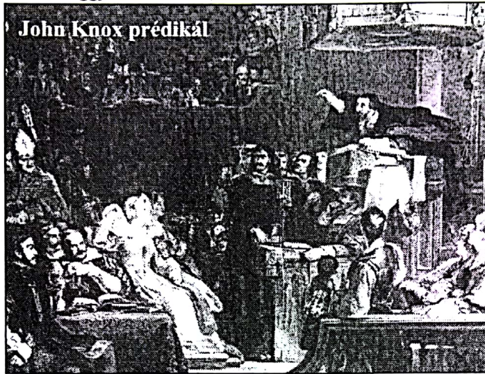
John Knox prédikál

Mostantól fogva nemcsak elhiszük mindazt, amit az Úr Jézus értünk tett, hanem rá is bízunk életünket. Ez az a hit, amely megnyilvánul az igazi megtérésben. A zsoltáros szerint, aki ilyen hittel hagyatkozik Krisztusra, az így tesz bizonyosságot: „Amilyen az elválasztott gyermek az anyjánál; mint az elválasztott gyermek, olyan